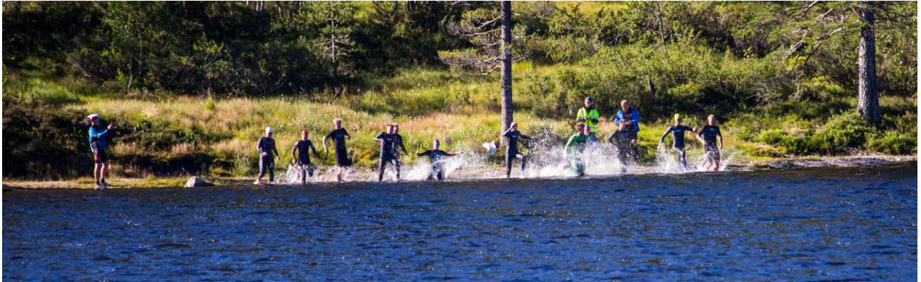
Frå Bortelid Triathlon, 5.09.15