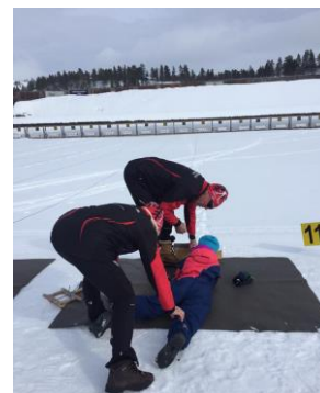
Skiskyttararenaen på Bortelid.

BAA i samarbeid med ÅIL søkte om spelemidlar til tidtakarutstyr for arenaen i 2014. Desse midlane fekk ei førehandsgodkjenning, utstyret vart kjøpt inn og montert før sesongopning med skiskyttarrenn i desember. ÅIL forskoterte desse midlane for BAA, som da er å anse som eit privat lån. Totalkostnad inklusiv dugnad er på kr. 134.450,-, og bokført gjeld per 31.12.15 er kr. 101.106,- Idrettslaget vil arbeida vidare med å utvikle anlegget på Bortelid saman med samarbeidspartnarar.