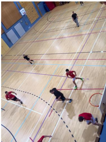
Frå romjulas futsal-turnering i Fleirbrukshallen, 28.12.15.

Idrettslaget har og vore med å arrangere Bortelid Triathlon og skirennnet Bortebeineren i samarbeid med Bortelid Skisenter. Det visast elles til egne årsmeldingar frå undergruppene.