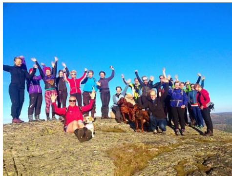
Tur for alle! Ein glad gjeng!