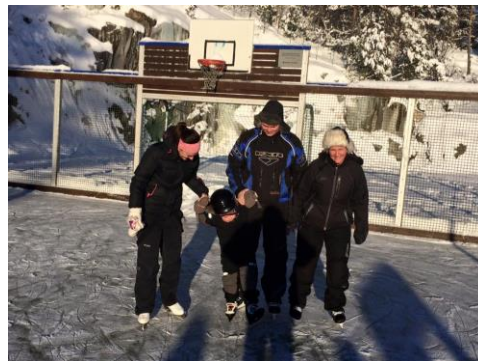
Tre generasjonar samla på den islakte ballbingen.